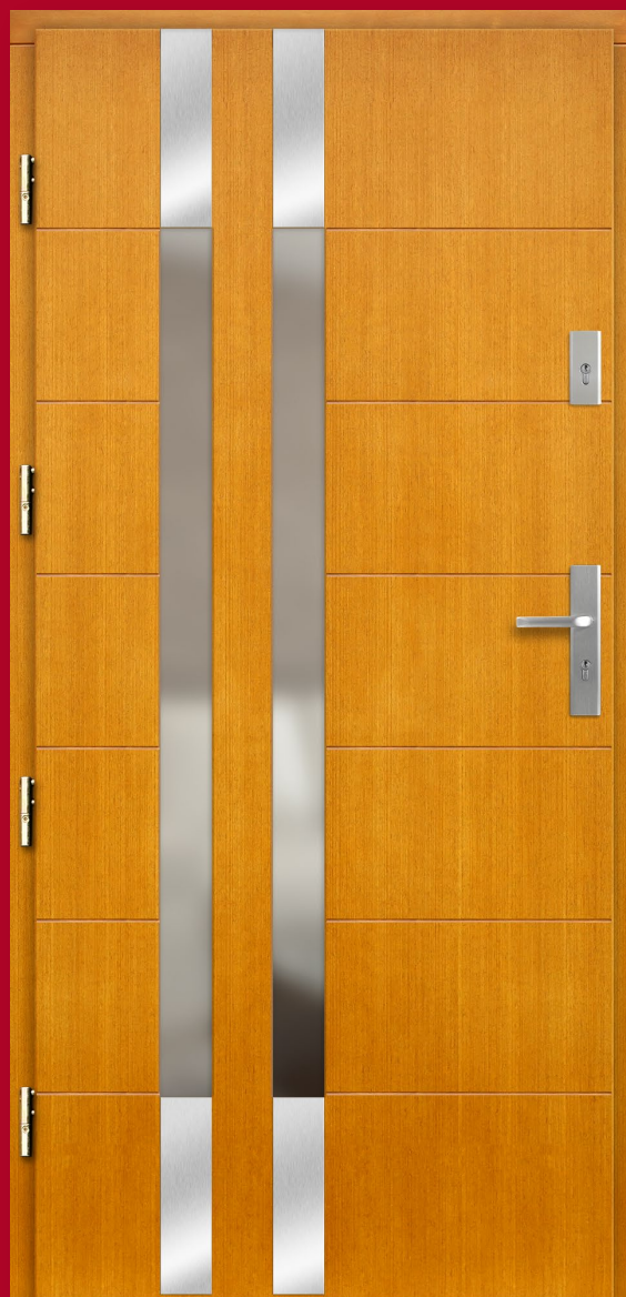
kolor: ZŁOTY DĄB